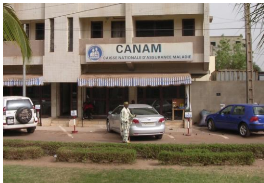
(Claire Boulanger, 19/03/2012)

On ne peut que difficilement imaginer le désordre créé par ce type de vide réglementaire. Une administration sans réglementation claire ne peut que se transformer en coquille vide, voire en organisme de racket ou chaque acte administratif fait l'objet d'une transaction financière. Une autre illustration de cette méfiance, devenue défiance, est le fait que le siège de la CANAM à Bamako fut l'un des premiers bâtiments saccagés durant le coup d'état.