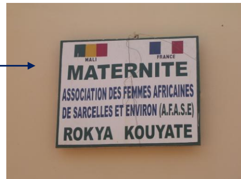
Maternité du CSCOM de Torokorobougou, Bamako. (Claire Boulanger, 17/02/2012)

La participation à ce type de chantiers internationaux peut parfois servir de tremplin pour des descendants de migrants qui, forts de ces expériences, prendront le relais de leurs aînés dans le soutien aux villages d'origine de leurs parents.